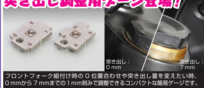
フロントフォーク組付け時の0位置合わせや突き出し量を変えたい時、0mmから7mmまでの1mm刻みで調整できるコンパクトな簡易ゲージです。